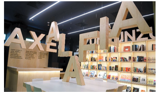
O acervo do espaço conta história da música baiana